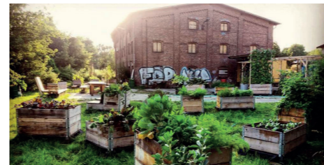
Reallabor Berlin: Neuer-St. Jacobi Friedhof in Neukölln und Gut Hellersdorf